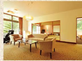
14畳のリビング付き和洋室

全9室。静かに“時”を楽しむ大人のための隠れ家。それが杓風華のコンセプト。館内には心地よく揺れるハンモックや、草津温泉ならではの湯のみ板など、遊び心も満載。ダイニングはテーブルごとに区切られ、プライベート感もたっぷり。お部屋も用途によって選べる3タイプ。