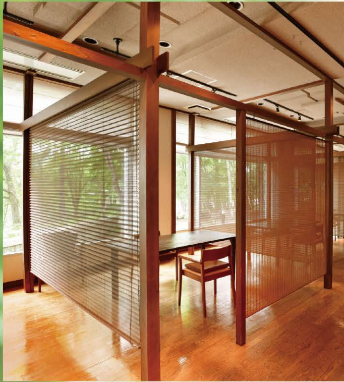
プライベート空間が演出されたダイニング