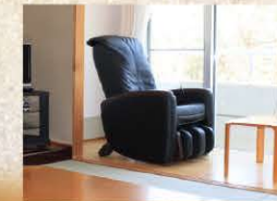
全室マッサージチェア設置