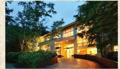
緑に囲まれた宿周辺には四季の草花があふれ、春のエントランスには草津町の花「しゃくなげ」が一面に咲きほこります。