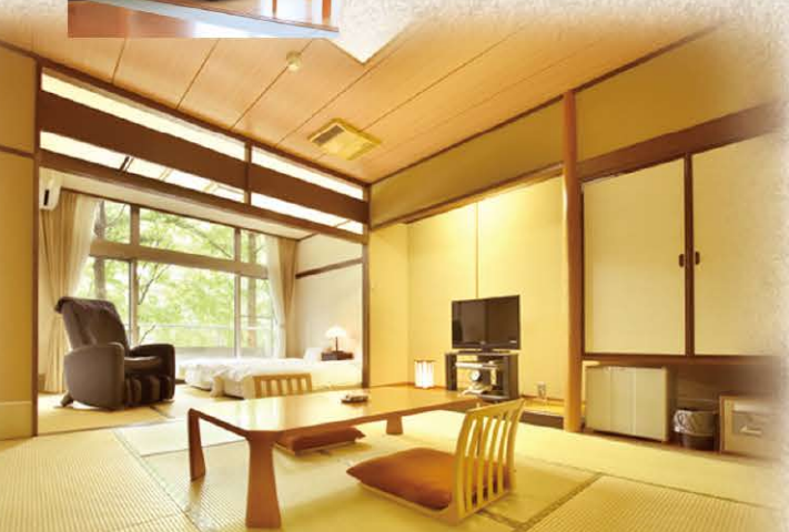
ほっと心が和む量の感触「和室10畳タイプ/ローベッド設置」