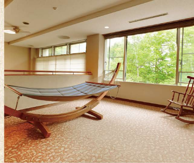
館内には、ひと際目を引くハンモックを設置