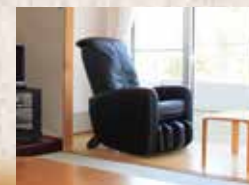
全室マッサージチェア設置