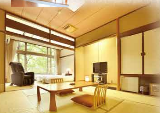
ほっと心が和む量の感触「和室10畳タイプ/ローベットの設置」