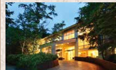
緑に囲まれた宿周辺には四季の草花があふれ、春のエントランスには草津町の花「しゃくなげ」が一面に咲きほこります。