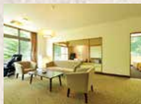
14畳のリビング付き和洋室

ひっそりと、静かに時を楽しむ大人の隠れ家。それが杓風華のコンセプト。吹き抜けロビーには心地よさげなハンモックが揺れ、落ち着いたダイニングもプライベート感たっぷり。お部屋は和モダン・和室・和洋室の3タイプから、ご宿泊のスタイルに合わせてお選びください。