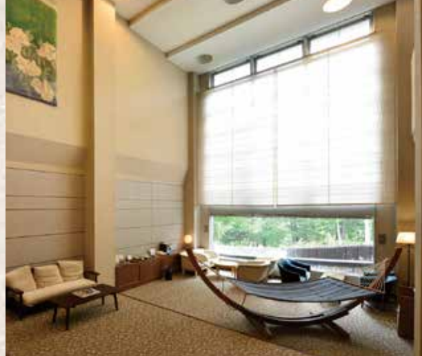
吹き抜けロビーにはハンモックが