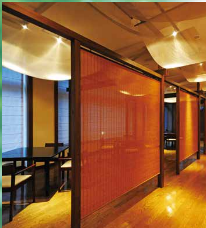
和の空間をモダンにアレンジしたDining「緑湧庭」